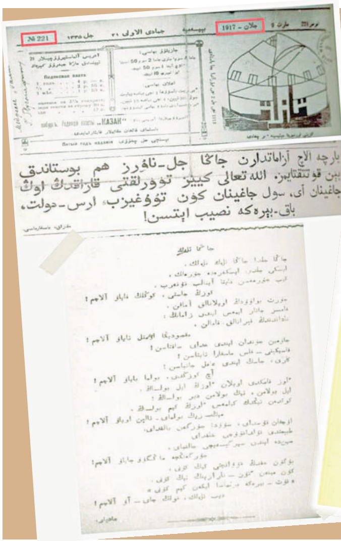
«Қазақ» газетінің 1917 жылғы 9 наурыздағы №221 саны